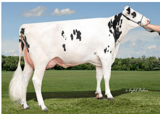
HIGHERRANSOM HUEY NOT GRANDDAM